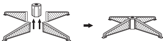
Fig A - Tree Stand Assemblage

Insérez les pieds dans les fentes de la base et glissez-les vers le haut jusqu'à ce qu'ils soient solidement fixés.